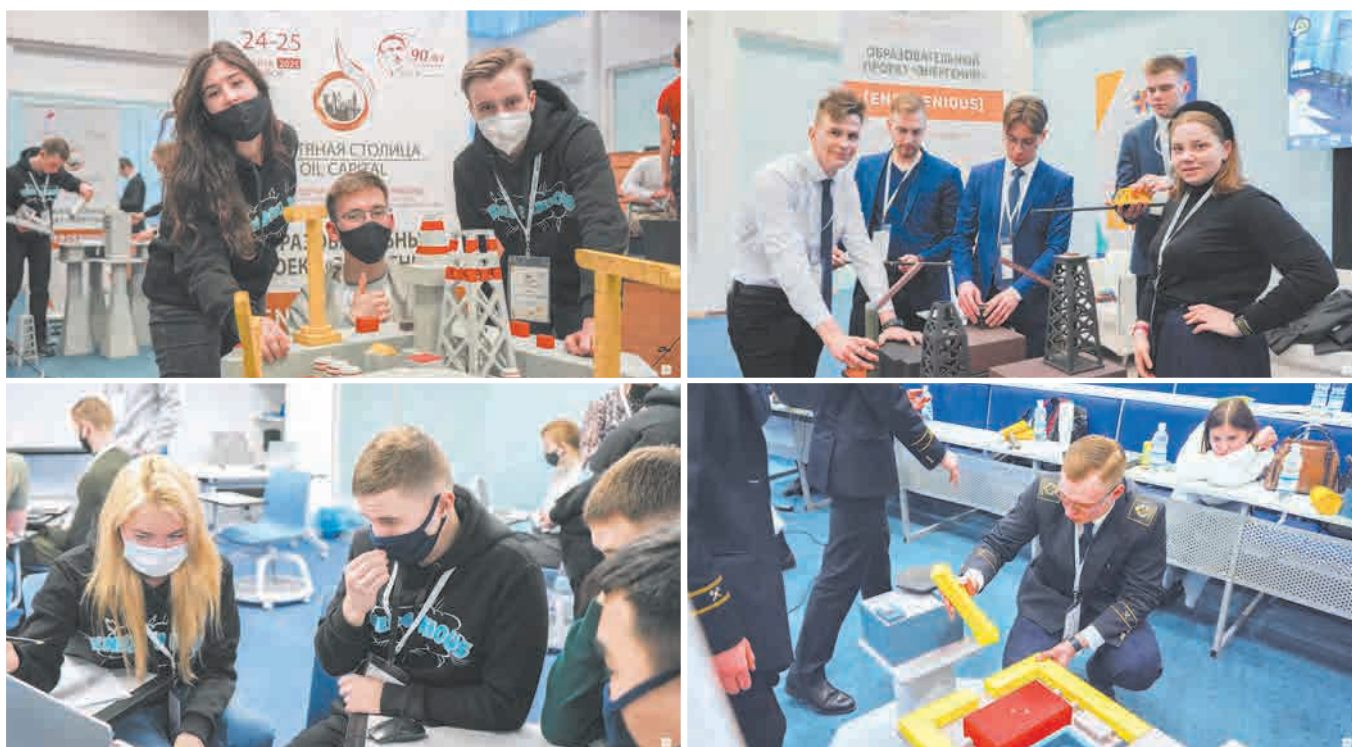
Рабочие моменты финального этапа кейс-марафона «ЭнерГений». Ханты-Мансийск, март 2021 г.

Образовательная программа «ЭнерГений», созданная Российским национальным комитетом Мирового нефтяного совета, быстро набирает популярность. Особенно велик интерес к проводимым в рамках программы кейс-марафонам. Впечатлениями об образовательном марафоне делятся его участники.