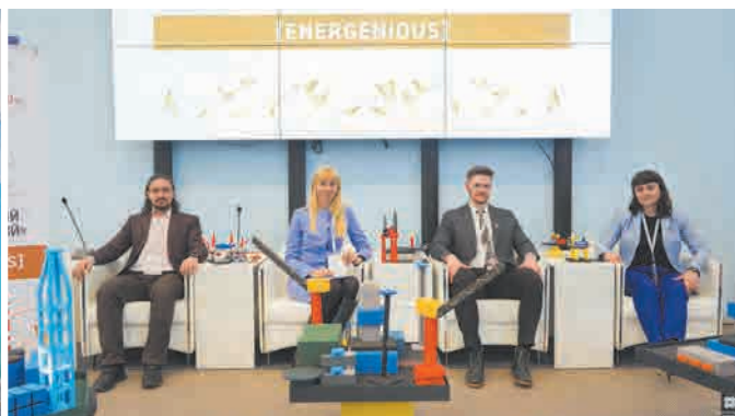
Работы финалистов кейс-марафона «ЭнерГений» оценивало профессиональное жюри. Ханты-Мансийск, март 2021 г.